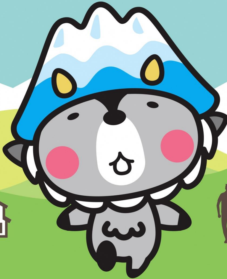
大町市キャラクターおおまぴょん